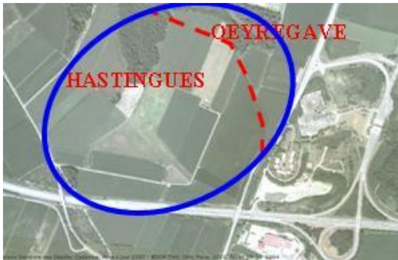
Localisation ZAC Sud Landes

Une première réalisation sur la ZAC Sud Landes Non